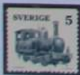
Locomotora a vapor "Gotland", fabricada en 1878.