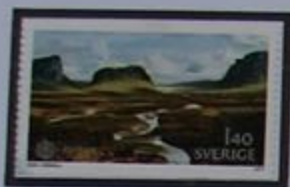
El valle de Rapa en Sarek.

Laponia es la provincia con verdaderos espacios abiertos. Las distancias se miden en horas, no en kilómetros. Con el autocar correo, haciendo la "Ruta Oeste" llegamos a las cataratas Stora Sjöfallet.