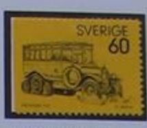
Autobús postal Kalix-1924.