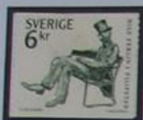
Estatua de Nils Ferlin en Filipstad.

Esta es la provincia por la que podemos viajar acompañados de poesía, música y sellos. Fryksdalen se ha convertido en el corazón de Värmland por los escritos de Selma Lagerlöf quien, no cabe recordarlo, también escribió "Las maravillosas aventuras de Nils", a quien seguimos en este viaje a vista de pájaro por Suecia.