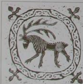
Detall av glas från 1400-talet. Dalhem kyrka i Småland