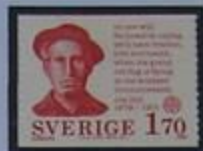
El activista obrero Joe Hill, nació en Gävle.