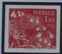
La flor geminada, símbolo floral de Småland.