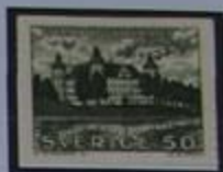
Skokloster, uno de los palacios mas bellos de la época del Gran Poder.