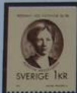
Kerstin Hesselgren primera mujer parlamentaria.