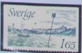
Señales de navegación, para la seguridad.