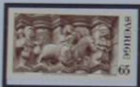
"La Huida a Egipto"-Pórtico de la iglesia de Stånga, siglo XIV.