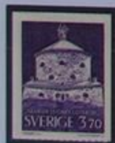
El fuerte Westgötha Lejon(1689) en Göteborg.