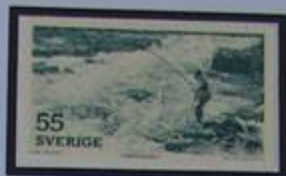
Pesca del salmón en el torrente Mörrum.