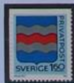
Dos ríos componen el escudo de armas.

Aquí tuvo también lugar la primera huelga general de Suecia, la huelga de Sundsvall de 1879.