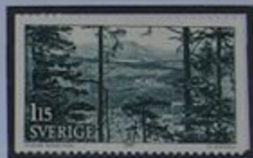
Vista de Enånger.