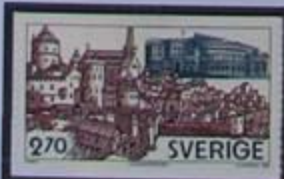
El Riksdag volvió a Helgeandsholmen en 1983.