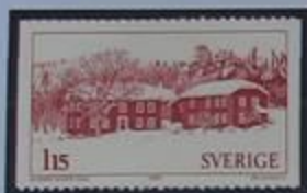
Las granjas en Hälsingland se componen a menudo de varias casas.

Hasta finales del siglo XIV Hälsingland se extendía desde los bosques Ödmården, en los límites de Gästrikland Sur, hasta el norte "tan lejos como los lugares donde "habie llegado el hombre".