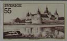
Palacio Kalmar, un antiguo castillo wasa.