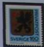
Escudo de armas de Södermanland.