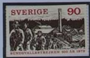
Huelga de 1879 en Sundsvall. Primera huelga importante en Suecia.

Medelpad es una pequeña provincia, por lo menos para el termino medio de los paísesnordicos. La carretera que une los límites solo tiene 60 kilometros La población se concentra en el área de Sundsvall y esto ha sucedido desde siempre.