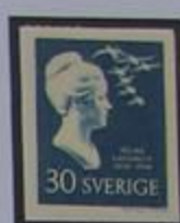
Selma Lagerlöf. Premio Nobel de Literatura en 1909.