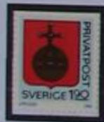
Escudo de armas de Laponia.

Y la última etapa de nuestro viaje será desde Karesuando por la "Carretera de los cuatro vientos" en el lado Finlandés del río Kōnkämä hasta Kummavuopio. De aquí caminamos hasta el Monte del Tercer Reino alcanzando de esta manera el destino final del recorrido.