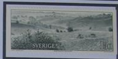
Linnaeus escribió acerca de las colinas Brösarp en sus viajes Escandinavos.