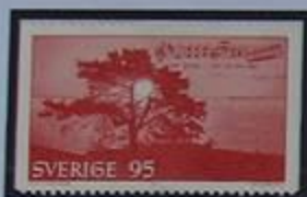
Evert Taube, uno entre muchos que canto al archipiélago Roslagen.

En Grisslehamn quedan vestigios del correo a remos a Aland.