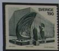
La "Cueva de los vientos" y ayuntamiento de Västerås.