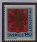
Escudo de armas de Östergötland.