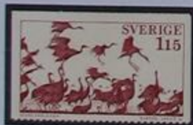
Grullas en el lago Hornborga.