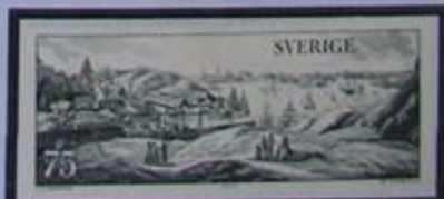
1793, Vista de Estocolmo.