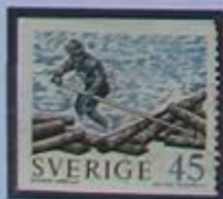
Trasporte de madera por el río.