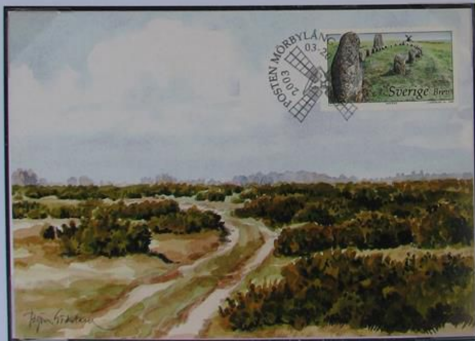
La superficie plana de la meseta puede ser vista claramente en el Alvar, el suelo calizo y el clima templado favorecen su flora rica y variada.

De los molinos de viento solo se conservan 400 de los mas de 2000 existentes al terminar el siglo pasado.