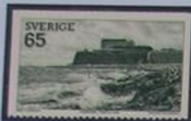
Castillo Varbergs. XVII Museo.

Costas, llanuras y sierras boscosas nos esperan en Halland. Desde las tierras altas del este, el paisaje desciende suavemente hasta el mar. Desde la sierra sur de Halland se puede contemplar la bahía de Laholm y la playa de arena mas larga del país. El castillo de Varberg se levanta en la roca para recordarnos las viejas guerras. Hoy en día son los turistas los que invaden cada verano Halland.