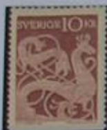
Dibujo en piedra, Öland siglo XI.

Öland, visto desde el aire parece un gigantesco y ordenado navío en el mar Báltico. El puente Öland, el mas largo de Europa, es un pasillo de 6.070 mts de largo que une la isla con el continente. Varios millones de turistas lo cruzan cada año para visitar esta isla tan peculiar. La isla rica en vestigios antiguos, entre los que se encuentran 19 grandes y viejos castillos. Un rasgo característico del paisaje son los numerosos molinos de viento.