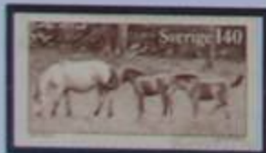
Ponis en Gotland.