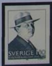
Hjalmar Bergman (1883-1913) nacido en Örebro.