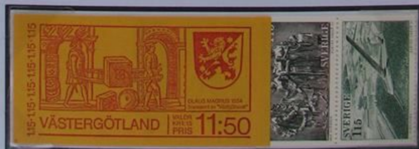
Carnet de sellos de Västergötland.