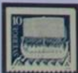
Nave vikinga. Dibujo en piedra. Parroquia de Lårbro siglo