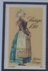
Mujer casada en traje de fiesta Gøinge Oeste.