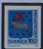
Escudo de armas de Västerbotten.