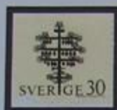
Cruz funeraria, del siglo XVIII. Iglesia de Ekshärad.