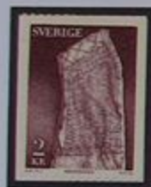
La piedra Rök con la mas extensa inscripción rúnica del mundo.