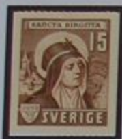
Santa Birgitta, fundadora del convento de Vadstena.

En Östergötland hallamos fértiles llanuras bordeadas por los sombríos bosques de Kolmården, el bello Gryt, Sta Anna y los archipiélagos Arkösund, las tierras altas de Smaland y el lago Vättern de profundas aguas. La "Banda Azul" de la zona oriental sueca, el canal Göta, atraviesa Östergötland. Desde el barco que hace el servicio del canal hasta el lago Vättern, podremos ver Övralid, lugar de residencia del escritor y Premio Nobel Verner von