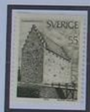
Glimmingehus, el castillo medieval mejor conservado en los países