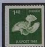
Pájaro de madera, Dalsland.