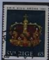
Corona Real de Erik XIV.