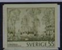
Típico paisaje de la Suecia central.