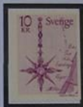
Flecha del Norte-mapa de 1769 del pueblo de Frändesta.