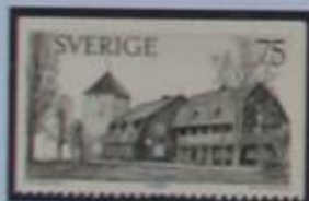
Torre del polvorin y la Casa del Curtidor en Visby.