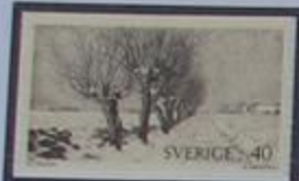
Sauces escanios al comienzo de la primavera.

Comenzamos este viaje donde emergió del hielo la primera tierra Sueca hace 14.000 años Skåne, nuestra provincia mas meridional, es el granero de Suecia. Atravesamos caminos bordeados de sauces, bosques de hayas, campos ondulados y grandes cordilleras. Malmo tiene derechos municipales que datan de hace 700 años y es la "Capital" de Skåne.