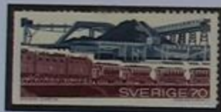
Industria del hierro, una vieja y básica actividad sueca.

Aquí, al norte del Círculo Ártico en "la tierra del sol de medianoche", se encuentran una tercera parte de los parques nacionales del país, siendo uno de ellos el de Sarek.