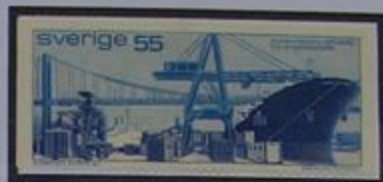
El puerto de Skandia en Göteborg-el mayor puerto de contenedores en Suecia.