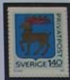
Escudo de armas de Öland.