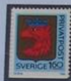
Escudo de armas de Skåne.