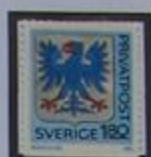
Escudo de armas de Värmland.