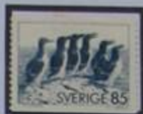
Araos y alcas en el Gran Karlsö.