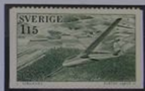
Vuelo sin motores en Alleberg.