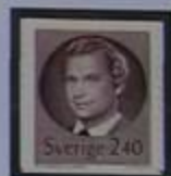
S.M. el Rey Carl XVI Gustaf.