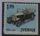
El primer Volvo, 1927, producido en la fábrica de Göteborg.

Västergötland presenta un paisaje muy variado. Hay altas montañas y planicies, así como grandes bosques. Desde Alleberg se puede contemplar Falbygd en donde hace 4.000 años se enterraba a los muertos en tumbas de roca en galería. En la misma época, se construían pirámides en Egipto. Otra modalidad de viajar por Västergötland es en barco por el canal Göta desde el lago Vättern al lago Vänern, pasando por Källandsö con su castillo renacentista Läckö y desembarcando en Vänernborg.