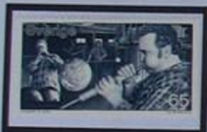
Expertos sopladores de vidrio han dado al cristal sueco renombre mundial.

Viajando por Småland nos encontramos con todo tipo de paisajes, desde un archielago magnifico hasta bosques extraños. Los habitantes de Småland tienen fama de ser un pueblo recio y trabajador. muchos de ellos emigraron a América en el siglo XIX.