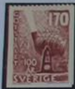
Convertidor Bessemer usado en 1858.

Hasta comienzos del siglo XIV Gästrikland fue parte de Uppland. El paisaje es similar, menos en el noroeste donde comienza el norte montañoso. Gävle es el puerto donde se desembarca el pescado y se embarca el hierro. El palacio construido por Johan III, es sede del gobernador.