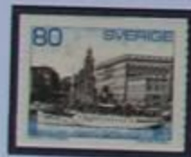
Un barco. Vaxholm. Palacio Real y Iglesia Mayor.