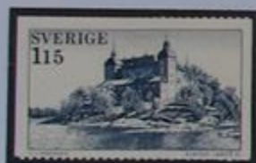
El castillo Läckö visto desde la orilla del lago Vänern.