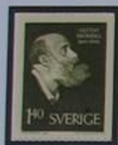
El poeta Gustaf Fröding nacido cerca de Karlstad.