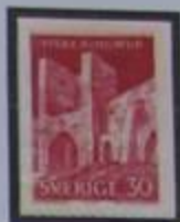
Muralla circular en Visby, Puerta Norte.