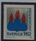
Escudo de armas de Västmanland.