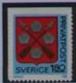
Escudo de armas.