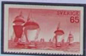
Regatas de veleros, costa oeste en verano.