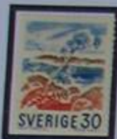
El archipiélago ofrece muchos temas para los artistas.

En Södermanland todo tiene un magnifico marco, imponentes castillos y casas solariegas, idílicas casas de campesinos, los viejos talleres y las modernas industrias. Y allí encontramos tierra todavía virgen en el archipiélago.