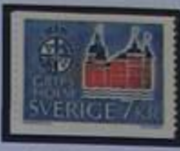
El palacio Grips-holm, una visita obligada.