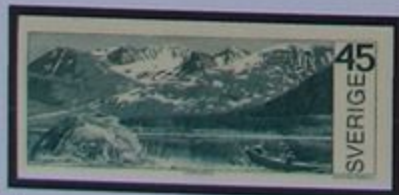
La montaña Akka en el parque nacional de Stora Sjöfallet.