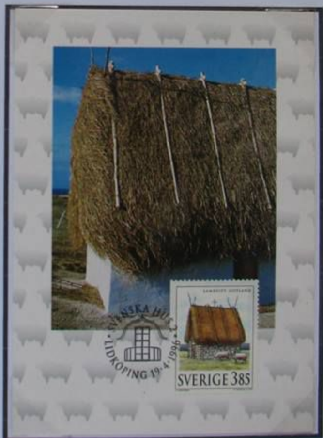
Tarjeta Máxima de Gotland.