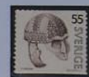
Casco guerrero (550-800 d.j.) hallado en la Iglesia Vendel.