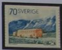
Un autocar correo por Vietas.

Aquí, al norte del Círculo Ártico en "la tierra del sol de medianoche", se encuentran una tercera parte de los parques nacionales del país, siendo uno de ellos el de Sarek.