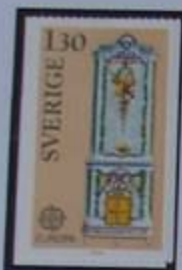
Chimenea de azulejos Marienberg procedente del palacio Sturehov.