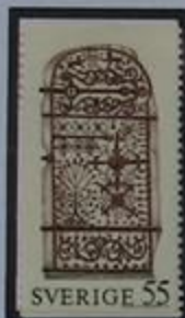
Puerta de hierro forjado. Iglesia de Björksta-siglo XIV.