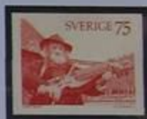
Violin- instrumento típico de Uppland.