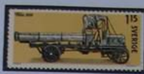
Camión del año 1909. Museo Scania de Södertälje.