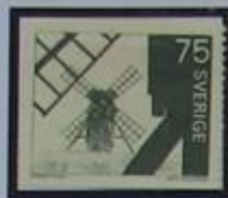
Molinos de viento, Runsten.