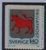
Escudo de armas de Dalsland.

Dalsland, una de nuestras mas pequeñas provincias, se encuentra escondida entre el lago Vänern y Noruega. El canal Dalsland, actualmente una ruta turística, se construyó en el siglo XIX para facilitar el transporte de herramientas y fundiciones de la zona.