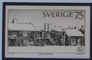
Las mas antiguas casas, en la parroquia de Skellefteå datan del siglo XVII.

Västerbotten es la provincia que realmente nos proporciona oro. Los hallazgos primeros tuvieron lugar en Boliden y luego se extendieron a todo Skelleftefältet. Desde esta región el mineral va a la gran planta de fundición en Rönnskär, al sureste de Skellefteå.