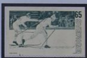
Muchos esquiadores proceden de Västerbotten.