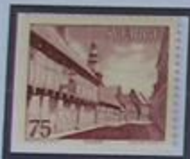
La casa Kemner en Ystad.