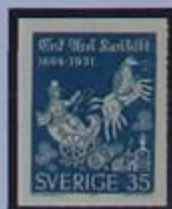
"El viaje de Elijah a los cielos" de E.A. Karlfeldt. Pintura Delecarlian.