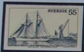
Goleta Falken de la Armada Real en la ruta de Karlskrona.

Desde Skåne tomamos la carretera de la costa que transcurre por inmensos bosques de Hayas (los mas grandes del país) hasta Blekinge. Cercana a Öland, esta la provincia mas pequeña de Suecia.