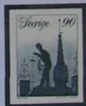
Tejado del que fue Hotel Knaust.