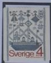
Detalle de un festivo brocado campesino.