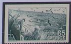
La pesca es un importante sector.