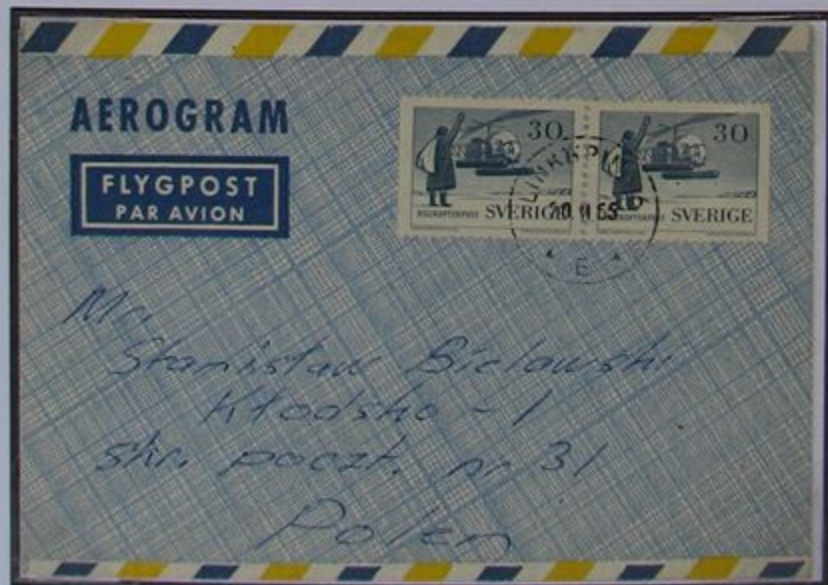
Linköping es el centro administrativo y cultural. En la plaza mayor, se puede admirar la fuente Folkunga de Carl Milles.

El primer monasterio fue construido en Suecia en el siglo XIII en Alvastra, al pie del Omberg.