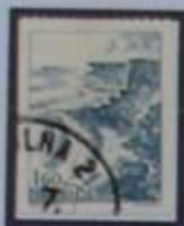
El Gran Karlsö tiene interesantes rocas habitadas por aves. Lugar de antiguos