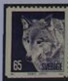
El lobo está casi extinto.