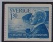
Verner von Heidenstam. Al fondo el lago Vättern y Omberg.