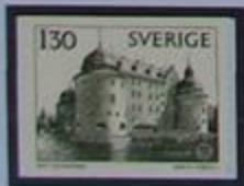
Castillo Wasa, Palacio Örebro, actual residencia del gobernador.

Närke es una de las mas diminutas joyas de nuestra provincia. En el centro hay una fértil llanura rodeada de una cadena de montañas majestuosas y azules. Örebro es la capital y un centro del oeste sueco con derechos municipales que datan del siglo XIII. Se encuentra en una llanura en la bahía del lago Hjälmaren. El castillo de Örebro, un antiguo fuerte Wasa fue construido en un estratégico vado dominando el torrente.