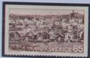
Mollösund, pueblo pescador en Bohuslän.

La costa de Bohuslän es una costa pelada y rocosa. Cuenta con mas de 3.000 islas grandes y pequeñas, islotes y peñones. Emerge del mar en un esplendor único, característico de este archipiélago. Pasamos por el rio göta y el fuerte de Bohus, construido en 1308. Cruzamos los puentes a las islas mayores de Tjörn y Orust. Luego continuamos por una red de pueblecitos de pescadores hasta llegar a