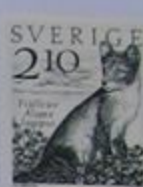
El zorro ártico Fjällräv, quedan solamente 500 ejemplares.