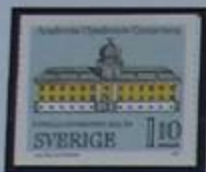
Gustavianum, un famoso edificio universitario.

En nuestra visita a Uppland iremos de monumento en monumento. Este fue el corazón del Reino Svea. La antigua Uppsala fue la corte real desde el siglo V hasta la edad media. Pero Uppland no es solo Uppsala. También es las tumbas de los jefes vikingos en Vendel y Valsgärde, las pinturas medievales de las iglesias realizadas por Albertus Pictor en Härkeberg, y también lo es Skokloster, uno de los palacios mas notables del periodo del Gran Poder.