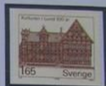
Museo de historia cultural en Lund.