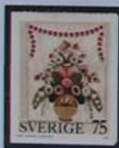
Cesto con flores estilizadas. Dibujo de un antiguo tapiz.

Para la mayoría de la gente, Dalarna solo quiere decir tierra alrededor del lago Siljan, con su irremediable a la iglesia, festivales de verano, folklore campesino, caballos de madera y pinturas primitivas de flores. Pero esto es solo una cara de Dalarna, la que atrae a los turistas.