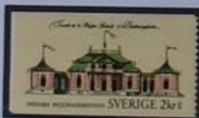
Palacio de China en el parque del Palacio Drottningholm.