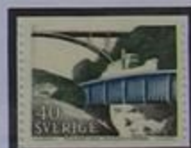
Acueducto en Häverud.

Monumentos Megalíticos en Dalsland. Un dolmen, que en bretón quiere decir 'mesa grande de piedra', es una construcción megalítica consistente, generalmente, en varias losas (ortostatos) clavadas en la tierra en posición vertical y una o más losas, a modo de cubierta, apoyadas sobre ellas en posición horizontal.