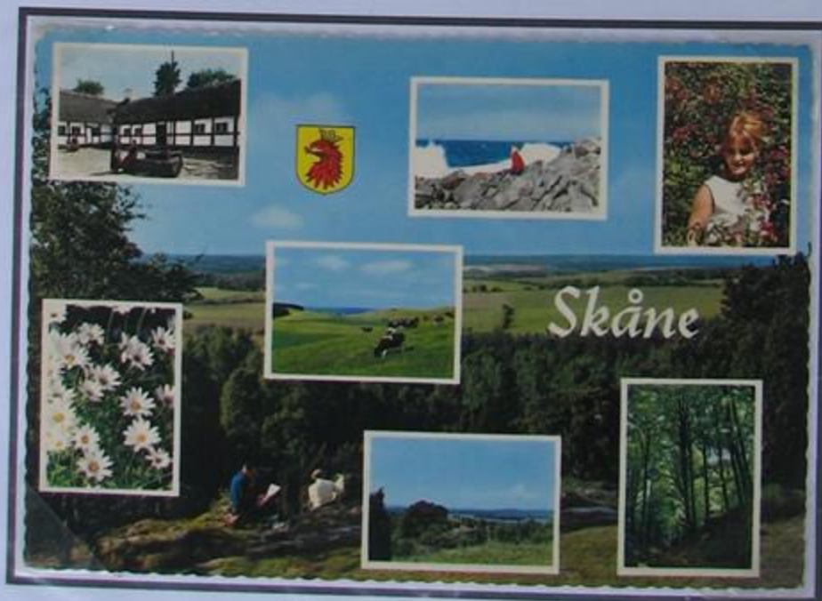
Tarjeta postal de Skåne.