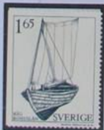
Antiguo barco utilitario de