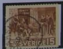
Olaus y Laurentius Petri, primeros traductores de la Biblia al Sueco.