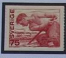
Ganchero, un oficio con tradición.