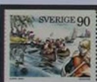
Un paraíso para piraguistas.