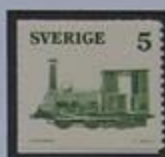
La locomotora "Fryckstad" de 1855.