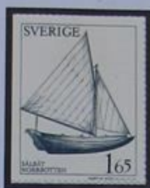
Velero de Norrbotten.