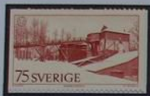
Fundición de madera en Engelsberg -siglo XVIII.

Viajar por el distrito minero de Västmanland es visitar la historia minera sueca. Minas abandonadas, hornos de fundición y herrerías jalonan la carretera. Pero algunas herrerías pueden ser vistas en funcionamiento todavía a lo largo del canal de Strömsholm. La historia del sello puede ser seguida en Kopparberg, donde quizá el sello mas valioso en el mundo fue timbrado con fecha de 13 de Julio de 1857, el conocido amarillo tres skilling banco.