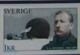
Andrée y su globo "El Águila"