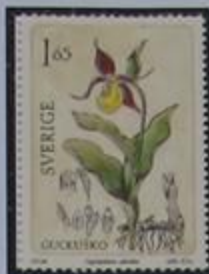
Zapatilla de la dama, una de las numerosas especies de orquideas.