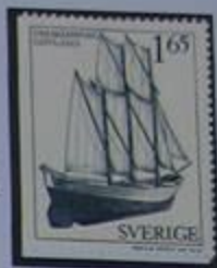
Antiguo velero utilizado en la pesca de altura con redes.