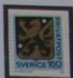
Escudo de armas de Västergötland.