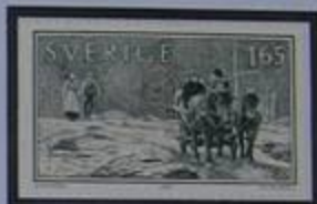
"Los Emigrantes" de Vilhelm Moberg describe la Suecia de hace 100 años.