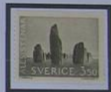
Las Rocas Ale, el mayor monumento megalítico de Suecia.