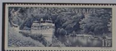
El barco Juno, que hace el servicio por el canal Göta.

El área de Vättern tiene gran interés histórico. Hay vestigios que datan de la época vikinga y de la edad media.