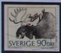
El alce, rey del bosque.

Podemos visitar la capital Umeå, la "Ciudad de los Abedules". Junto a la iglesia esta el parque Döbeln, en memoria del general que disolvió al ultimo ejercito sueco-finlandés en este lugar en 1809.