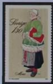
Joven de Mora vestida para ir a la Iglesia.