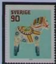
Caballos de madera hechos en Dalarna.