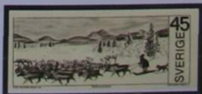
Tierra de lapones, tierra de renos.