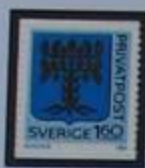
Escudo de armas de Blekinge.