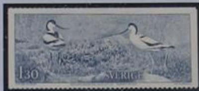
Avocetas en Södvinken.