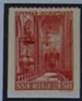
La Catedral gótica, inaugurada en 1435.