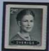
S.M. la Reina Silvia.

Fundada hace 700 años por Birger Jarl, esta considerada como una de las capitales mas bellas del mundo. "La Venecia del Norte", "La Reina Mälaren", "La ciudad en el agua", son algunos de los epítetos que se le han dado.