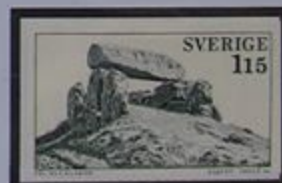
Tumba galería en Luttra.