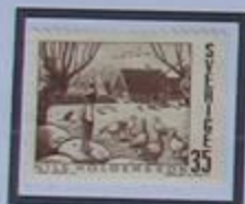
Nils Holgersson observando a los gansos en su casa de Vemmenhög Oeste.