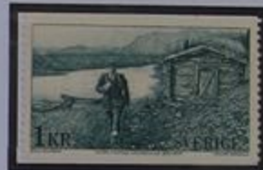
Cartero rural por el río Kōnkämä.

Y la última etapa de nuestro viaje será desde Karesuando por la "Carretera de los cuatro vientos" en el lado Finlandés del río Kōnkämä hasta Kummavuopio. De aquí caminamos hasta el Monte del Tercer Reino alcanzando de esta manera el destino final del recorrido.