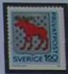
Escudo de armas de Gästrikland.