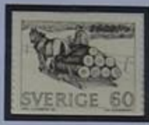
Madera camino del aserradero.