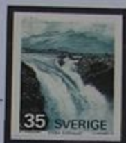
Cataratas de Sjöfallet.