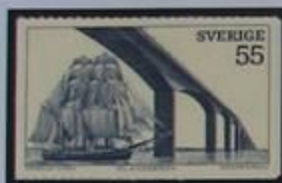
El puente Öland y el queche "Meta" de Byxelkrok.