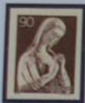
La Virgen de Öja, detalle de una escultura en madera del año

Ir a Gotland es como ir al extranjero desde la Suecia continental. La isla mas extensa de Suecia. Con sus escarpados acantilados, es geologicamente mucho mas joven que la parte continental. Visbi es una vieja ciudad Hanseatica a la que se le suele llamar la "ciudad de las rosas y de las ruinas". Su muralla circular es la mas notable de las numerosas obras medievales.