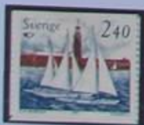
Veleros en el Riddarfjärden junto al Ayuntamiento.