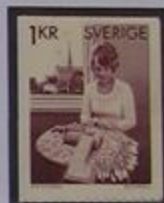
Encaje de bobina en Vadstena.

El primer monasterio fue construido en Suecia en el siglo XIII en Alvastra, al pie del Omberg.