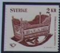
Una cuna en la parroquia Över-Kalix.

¿Cuántas personas saben que existe una "Riviera Norrland" con una temperatura excelente para poderse bañar en maravillosas playas donde se puede tomar el sol? En todas partes apreciamos los típicos pájaros que llega hasta el valle Tornedalen, país fronterizo. La línea fronteriza se trazo por medio del río con Finlandia en el tratado de paz con Rusia en 1809.