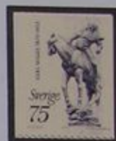
Folke Filbyter, de Cal Milles, Plaza Mayor de Linköping.