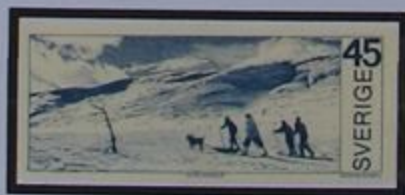
"Las últimas tierras vírgenes de Europa" atraen a muchos turistas.