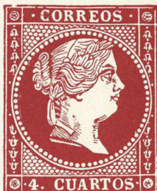
N.º 18 del segundo bloque

Nos ha llamado poderosamente la atención un defecto de plancha interesantísimo que se presenta en el núm. 18 del bloque derecho. Consiste este defecto en siete líneas de color paralelas, como continuación de las de sombra de la parte posterior del cuello de la efigie y que empiezan encima de la terminación de la cinta y van de mayor a menor en forma de cuerno. Damos una reproducción de esta variedad.