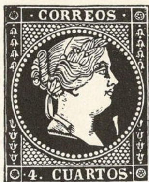
N.º 29 de la hoja de 100 sellos