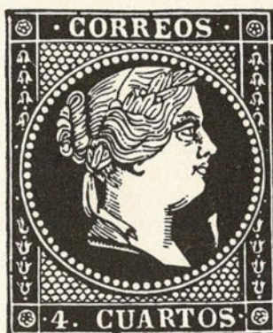
N.º 56 del bloque derecho de la 3.ª plancha

Los clisés o galvanos empleados en la confección de la plancha tercera fueron sometidos a una limpieza a fondo y en cada uno se marcó a buril la característica en el filete exterior del marco derecho frente a la línea blanca del recuadro.