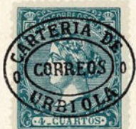
Núm. 309 Urbiola

Entre dos óvalos, CARTERIA DE URBIOLA y dos adornos, en el centro CORREOS. (Urbiola, Navarra).