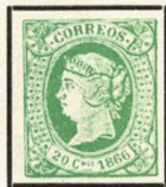
Ensayo de color