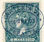
Núm. 310 Peralta

Entre dos óvalos, CARTERIA DE URBIOLA y dos adornos, en el centro CORREOS. (Urbiola, Navarra).