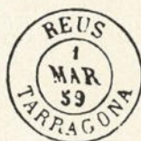
Núm. 144 Fecha, tipo de 1857