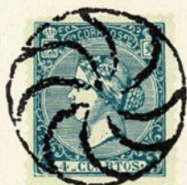
Núm. 298 Monforte de Lemos

RUEDA DE CARRETA CON LOS RADIOS CURVOS. Colección Fontecha, sobre carta entera procedente de Monforte de Lemos. (Lugo).