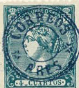
Núm. 311 Ares

Entre dos óvalos, CARTERIA DE PERALTA Y dos adornos. En el centro CORREOS. En azul. (Peralta, Navarra).