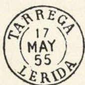
Núm. 129 * Fecha, tipo de 1854

Núm. 55. PARRILLA.—Núm. 149. RUEDA DE CARRETA.—Núm. 257. OVALO DE RAYAS CON NUMERO.—Núm. 273. RUEDA DE SALAMANCA (núm. 40).—Núm. 288. RUEDA DE MALAGA (núm. 6).