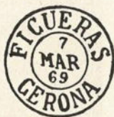
Núm. 144c Figueras

CARTAJENA-MURCIA. Error J en lugar de G.