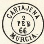
Núm. 144b Cartajena

CARTAJENA-MURCIA. Error J en lugar de G.