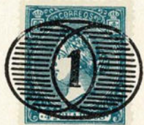
Núm. 303 Madrid

1 DENTRO DE DOS CIRCULOS EN- TRANTES CON FONDO RAYADO HO- RIZONTALMENTE. Madrid.