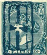
Núm. 300 Origen desconocido

CRUZ DENTRO DE UN DOBLE RECTANGULO. Desconocido su origen. En azul.