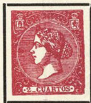
Ensayo de color