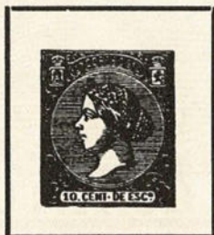
Prueba de artista