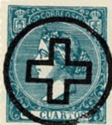
Núm. 301 Cuenca?

CRUZ BLANCA DENTRO DE UN CIR- CULO. Atribuido a Cuenca.