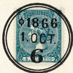
Núm. 302 ¿?