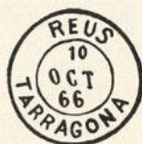
Núm. 144a Fecha, letras modificadas