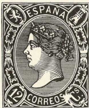
Medallón inferior derecho, roto 12 cuartos