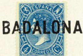
Núm. 294 Badalona

BADALONA. Timbre de la estación de ferrocarril. En negro. Visto, también, sobre un 4 cuartos de 1862.