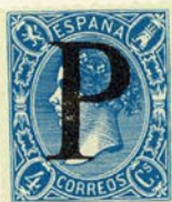
Núm. 293 Marca administrativa

8 largo, marca de porteo. Sobre 1 real sin dentar. Origen desconocido.