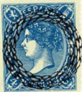
Núm. 286 Desconocido su origen

RODILLO DE PUNTOS. Rectángulo formado por ocho líneas de puntos de catorce cada línea. Madrid. En negro.