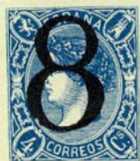
Núm. 131 Porteo

CERTIF. OROTAVA. En dos líneas dentro de un óvalo. En negro. Sobre un 2 reales sin dentar.