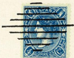
Núm. 142 Rejilla