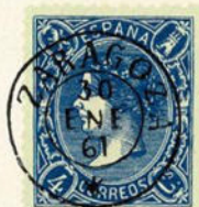
Núm. 127 *

OVALO DE RAYAS CON NUMERO. En negro y en azul.