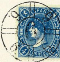
Núm. 288 Málaga

RUEDA DE CARRETA MODIFICADA DE SALAMANCA. Rueda núm. 40. En negro.