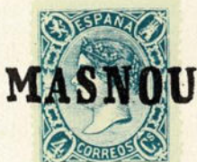
Núm. 296 Masnou

CALDETAS. Timbre de la estación de ferrocarril. En negro.