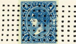
Núm. 285 Madrid

PARRILLA DE CUATRO RAYAS GRUESAS, dentro de un óvalo doble. En negro.