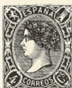
S de C s estrecha