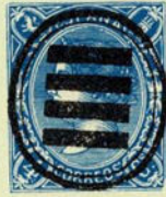
Núm. 284 Origen desconocido

PARRILLA DE CUATRO RAYAS GRUESAS, dentro de un óvalo doble. En negro.