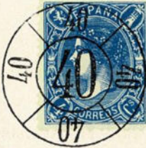
Núm. 273 Salamanca

RUEDA DE CARRETA MODIFICADA DE SALAMANCA. Rueda núm. 40. En negro.