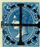
Núm. 287 Origen desconocido

CRUZ DENTRO DE UN CIRCULO DE PUNTOS. En negro.