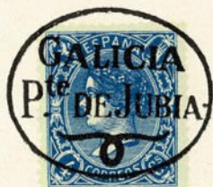
Núm. 281 Puente de Jubia

GALICIA-P TE DE JUBIA, y un adorno dentro de un óvalo. Puente de Jubia, Coruña. En negro.