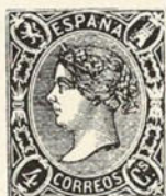
S de C s ancha