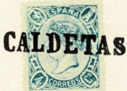
Núm. 295 Caldetas

CALDETAS. Timbre de la estación de ferrocarril. En negro.