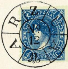
Núm. 274 Arzua