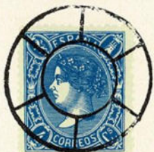
Núm. 272 Sta. Marta de Ortigueira

RUEDA DE CARRETA NORMAL. En negro en azul y en rojo.