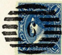
Núm. 257 Ovalo con número

RUEDA MODIFICADA DE LEON. N.º 31. Los círculos y las líneas de separación, son dobles. En negro.