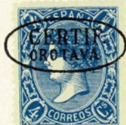
Núm. 283 Orotava

CERTIF. OROTAVA. En dos líneas dentro de un óvalo. En negro. Sobre un 2 reales sin dentar.