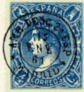
Num. 169 a

AMB. DESC. 2. a ESP (o ESPED) MADRID. En negro.