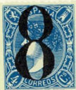
Núm. 292 Porteo

8 largo, marca de porteo. Sobre 1 real sin dentar. Origen desconocido.