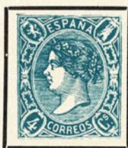
Variedad sin dentar