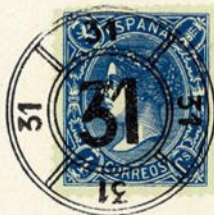
Núm. 289 León

RUEDA MODIFICADA DE LEON. N.º 31. Los círculos y las líneas de separación, son dobles. En negro.