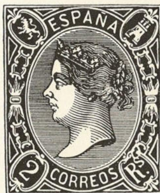
Retoque encima de la S de R s 2 reales