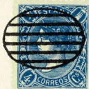
Núm. 55 * Parrilla