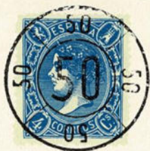
Núm. 149 Rueda de carreta

RUEDA DE CARRETA NORMAL. En negro en azul y en rojo.