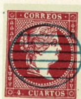
Núm. 139 *

PARRILLA PEQUEÑA. Ovalo de 20 por 16'50 milímetros, con seis líneas paralelas en su interior. Tintas negra, azul y roja.