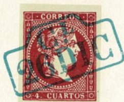
Núm. 148 Giro de Correos

CERTIFICADO MADRID y dos estrellas, entre dos círculos concéntricos, en el centro la fecha. Tinta azul.