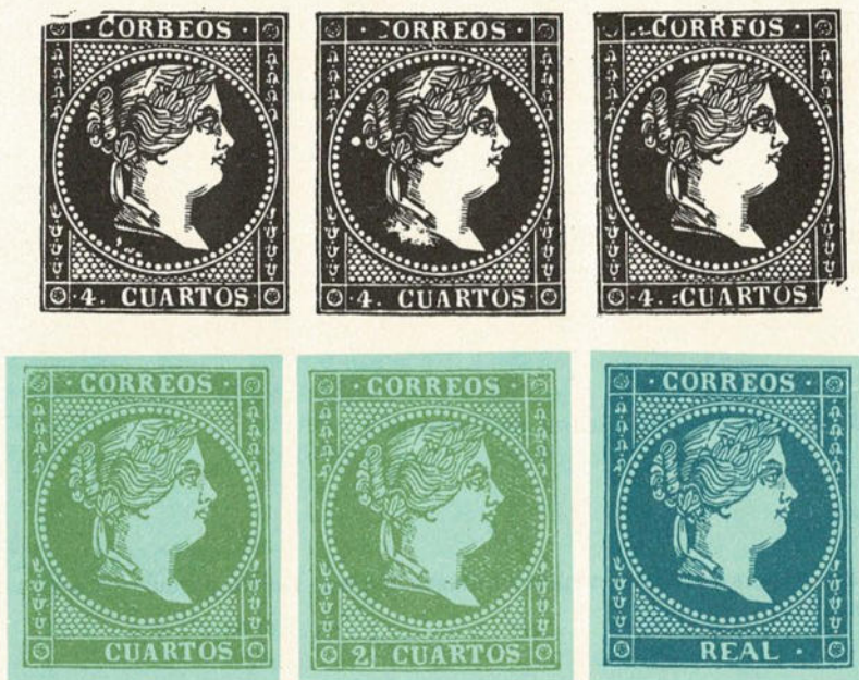
2 CUARTOS Sin cifra del valor

Incluimos en estos grabados diversos defectos observados en sellos de esta emisión