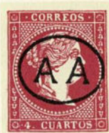
Núm. 133 *

A A dentro de un pequeño óvalo. Tinta negra.