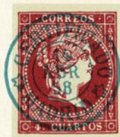
Núm. 147 Certificado Madrid

CERTIFICADO MADRID y dos estrellas, entre dos círculos concéntricos, en el centro la fecha. Tinta azul.