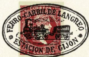
Núm. 140 *

G L y fecha en dos líneas dentro de un marco. Se empleó en la Central de Madrid. Tinta azul.