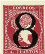
Núm. 131 *

A A dentro de un pequeño óvalo. Tinta negra.