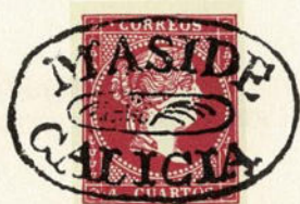
Núm. 150 Maside - Galicia

MASIDE GALICIA entre dos óvalos, en el centro un adorno. Tintas azul y negra.