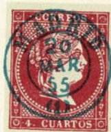
Núm. 128 *

TIMBRE DE FECHA. Igual que el anterior pero el número de la jerarquía postal substituye a la estrella. Tinta azul.