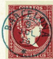
Núm. 127 *

TIMBRE DE FECHA. Dentro de dos círculos concéntricos, el nombre de la Administración principal y una estrella de seis puntas, en el centro la fecha. Tinta azul.