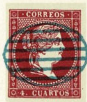
Núm. 55 *

PARRILLA NORMAL. Ovalo de 22 por 17 milímetros, con seis líneas paralelas en su interior. Tintas negra, azul, verde y roja.