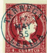
Núm. 129 *

TIMBRE DE FECHA. Igual que el anterior pero el número de la jerarquía postal substituye a la estrella. Tinta azul.